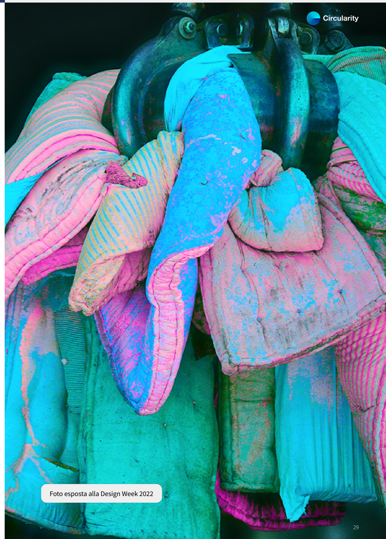
Foto esposta alla Design Week 2022

Per integrare al meglio i concetti della Circular economy e della sostenibilità all'interno del proprio modello di business Circularity, attraverso un approccio olistico basato sulla scienza, supporta le aziende nell'elaborazione della propria strategia di sostenibilità e nella transizione verso modelli di business più sostenibili, offrendo una vasta gamma di soluzioni che coprono l'intero percorso, dalla misurazione della propria carbon footprint al reporting sulla sostenibilità.